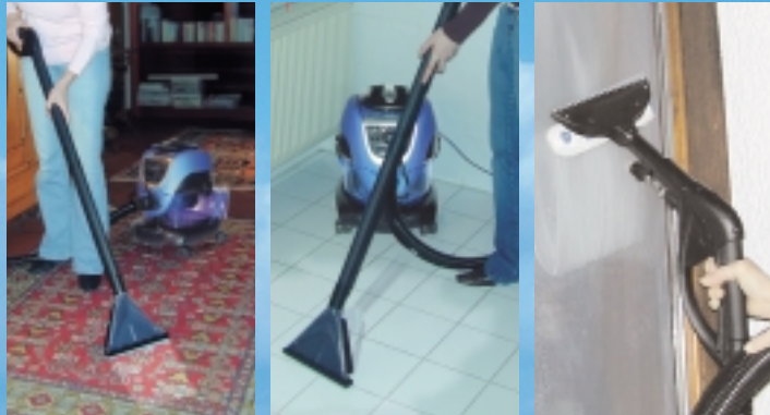
Nassreinigung von Teppichen und Fliesen sowie streifenfreies Fensterputzen sind ebenfalls möglich.