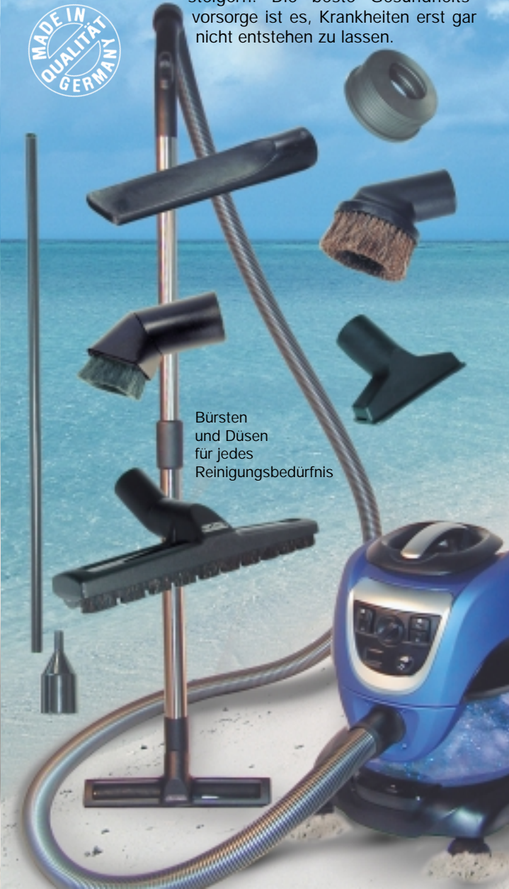
Bürsten und Düsen für jedes Reinigungsbedürfnis

Mit ätherischen Ölen oder medizinischen Inhalaten lässt sich das seelische Wohlbefinden steigern. Die beste Gesundheitsvorsorge ist es, Krankheiten erst gar nicht entstehen zu lassen.